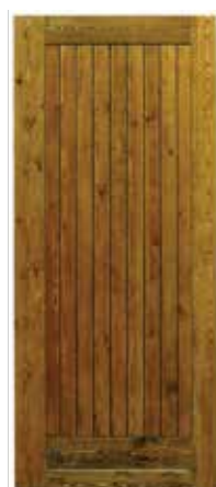
Perline con Telaio