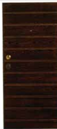
P8 In Massello