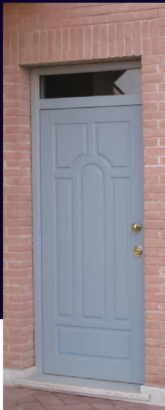
Modello C91 con pannello in legno