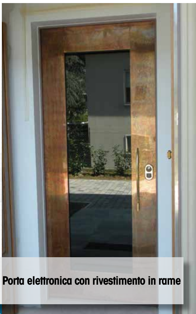
Porta elettronica con rivestimento in rame