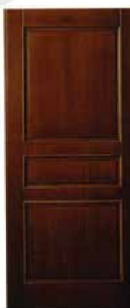
R6 Con Cornici