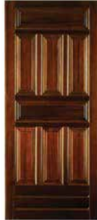
B51 In Massello