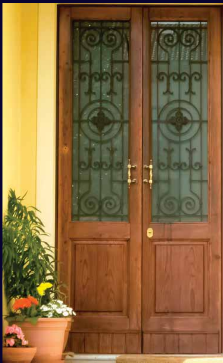
Modello DB a 2 ante e vetro antimazza con recupero dei pannelli delle vecchie porte in legno e dei decori in ferro