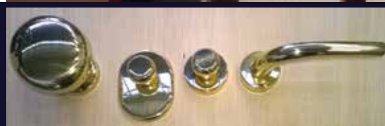
maniglia, pomolo e pomolini in ottone lucido di serie

Ogni modello della produzione DIGIEMME realizzato nelle classi antieffrazione 2 e 3 UNI ENV 1627/30 può essere dotato su richiesta del kit termico e/o acustico. L'applicazione del kit termico consiste nella applicazione di materiale isolante in lana di roccia o polistirene all'interno del battente oltre ad un ulteriore isolante in polietilene espanso a cellule chiuse tra la lamiera esterna dello stesso ed il relativo pannello di rivestimento, realizzato necessariamente nello spessore di 15 mm. Grazie a questa dotazione la porta blindata raggiunge il valore di trasmittanza termica U_d pari a 1,5 W/(m 2 *K).