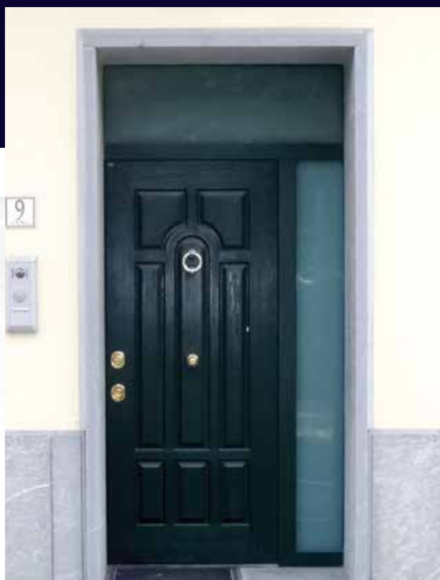
Modello F97 con pannello in resina