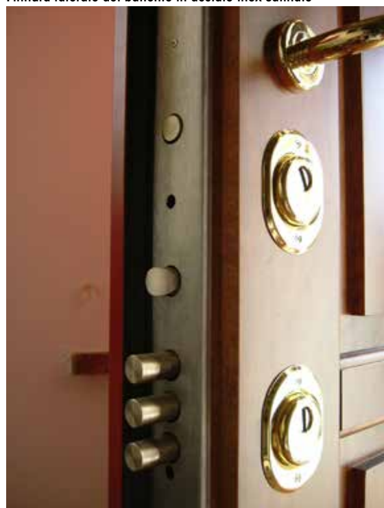
Finitura laterale del battente in acciaio inox satinato