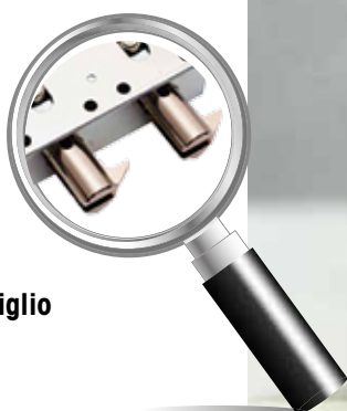
Deviatore con artiglio

Il battente ha un'armatura interna formata da quattro tubolari longitudinali e da due trasversali inframezzati da ulteriori strutture ad omega; per tutta l'altezza il lato serratura è protetto da un quasi scatolato su cui si trovano le piastre di protezione da 30/10 di serratura e deviatori: un piatto di 5 mm a protezione dei chiavistelli, 5 rostri in acciaio saldati sul lato cerniere ed un accoppiamento tra telaio e falso telaio irrobustito completano un prodotto che non teme confronti.