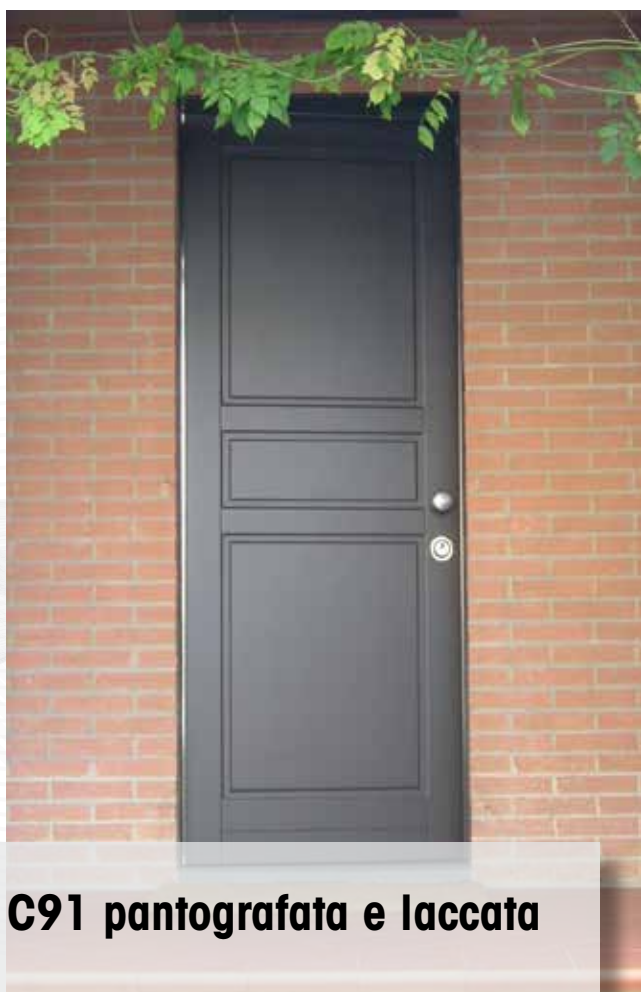
C91 pantografata e laccata