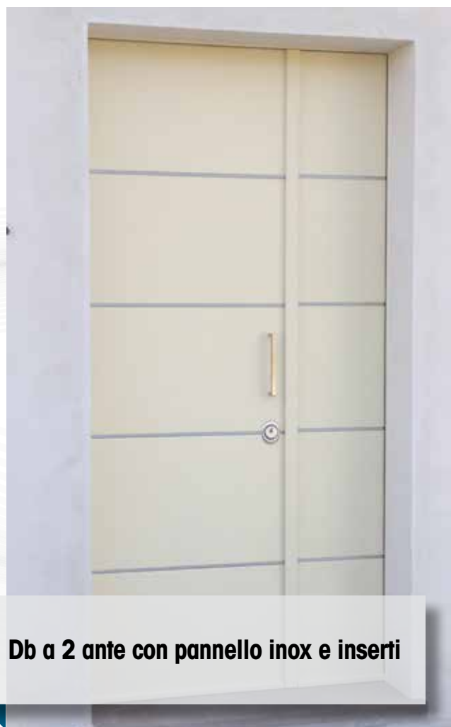
Db a 2 ante con pannello inox e inserti