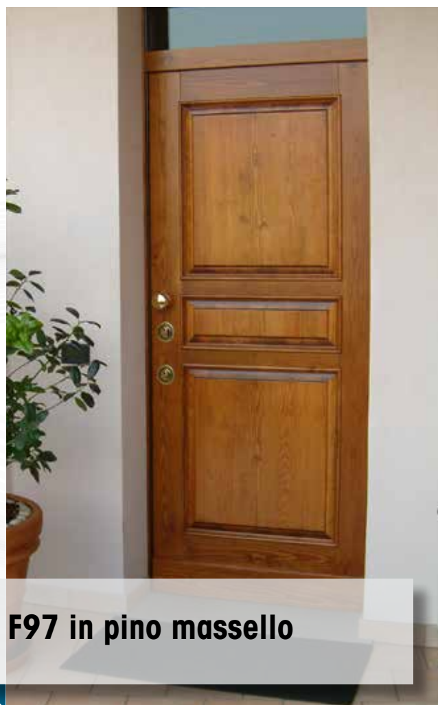
F97 in pino massello