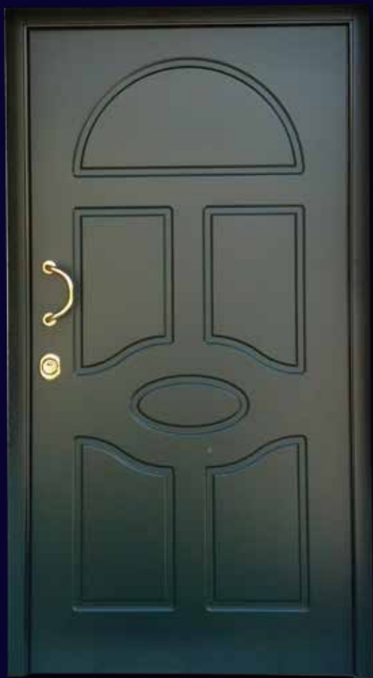
Modello C91 con pannello in alluminio