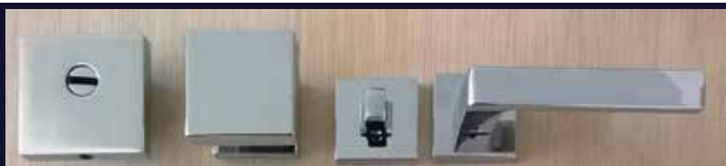
maniglia pomolo, pomolino e defender cromo-lucidi "quadra" (optional)